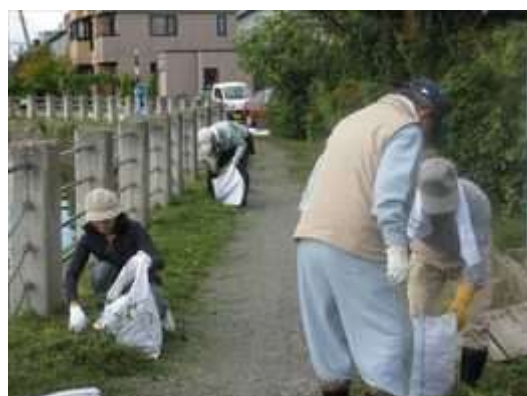
沖館第四町会の皆さんです

森林博物館横は木陰もあり、ゆっくり川の流れを眺めて心をリフレッシュしてみてもはどうでしょうか。