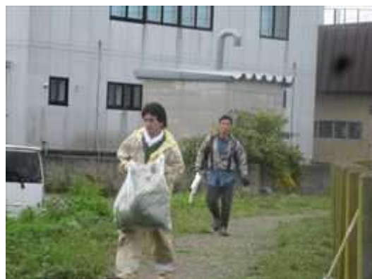
沖館川を考える会の皆さんです