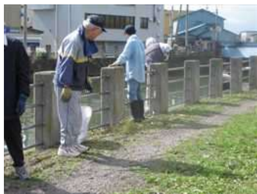
沖館第二町会の皆さんです