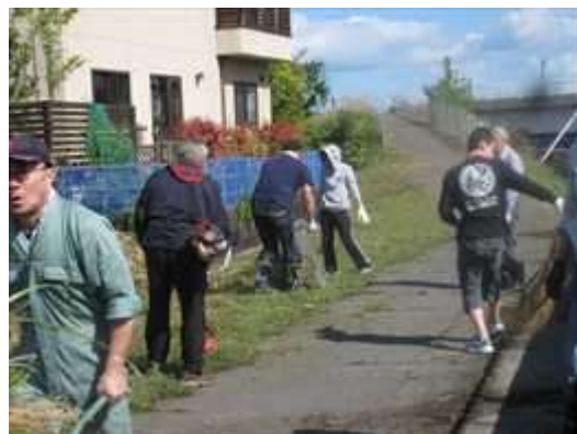
ベイトウン町会の皆さんです