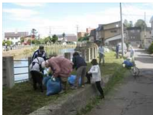
大福町会の皆さんです