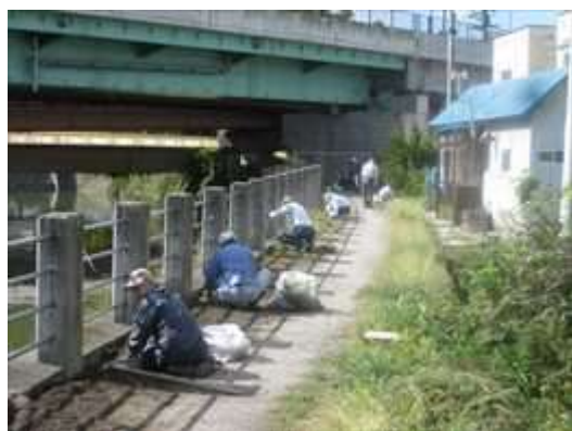
切島町会の皆さんです