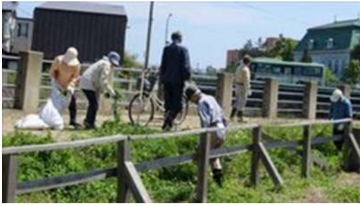
↑ 大福町会による土手の草刈風景（その3）です