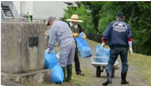
↑ 富田町会による土手の草刈風景です