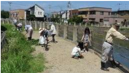
↑ 大福町会による土手の草刈風景（その1）です

6 月 2 9 日 ( 日 ) は 、 朝 か ら あ い に く の 雨 模 様 で 町 会 に よ っ て は 参 加 予 定 者 が 集 ま る 前 に 終 え た と こ ろ も あ り 、 こ の た め 写 真 撮 影 に 走 り 回 り ま し た が タ イ ミ ン グ に よ っ て 撮 影 で き な か っ た り 、 一 部 の 参 加 者 の み の 写 真 に な っ た り で 、 紹 介 し き れ な か っ た の は 残 念 で す 。 お 許 し く だ さ い 。