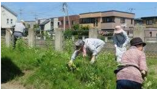
↑ 大福町会による土手の草刈風景（その2）です 写真（その1）に映っているお子さんたちも楽しそうに水辺で遊んで