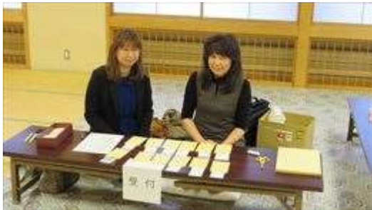
↑ 受付の様子です。会員が務めてくれました

『君子は和して同ぜず、小人は同じて和せず』（論語）とありますが、正に『和して同ぜず』の態度でありました。