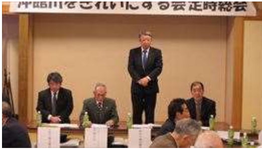
↑ 秋村青森市議会議員より祝辞を頂戴しました

立ってお話されている方が青森市議会議員で市議会副議長の秋村様です。 平素よりご指導・ご協力を賜り有難うございます。