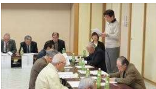
↑ 議事にしたがって報告する成田事務局長