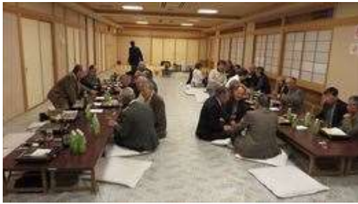
↑ 総会後の懇親会で談笑する皆さんの様子②

総会後の懇親会は、なかなか会う機会のない町会長さん達の情報交換の場としても活用していただいている様です。 今年も、18時頃から始まりましたが、盛り上がったこともあって19時30分過ぎまで続きました。 会場の後始末を終えたのが20時頃でした。