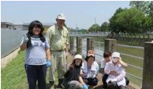
↑ 5/29 植え付け作業終了後にパチリ

皆さまの暖かいご寄付に期待して、今後とも『芝桜の水辺』をめざし、取り組んで参りますので、今後ともよろしくお願い申し上げます。