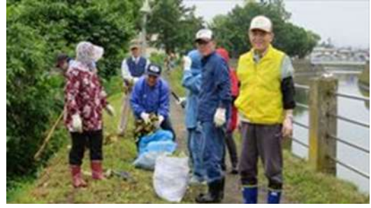
↑ 西上古川第二町会による土手の草刈風景（その1）です