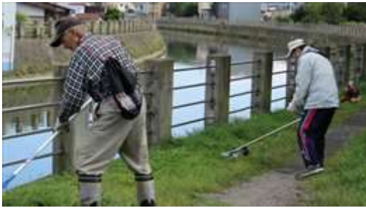
↑ 切島町会による土手の草刈風景です

9月21日（日）土手の除草作業をしている『切島町会』の皆さんです。（向かって左が沖館川）