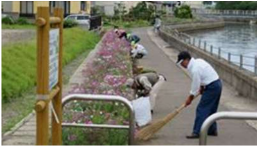
↑ 沖館地域緑の募金推進協会による花壇周りの清掃活動風景です