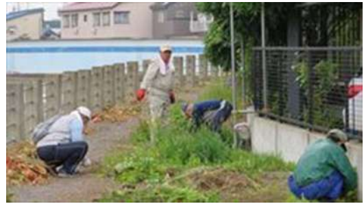
↑ 沖館第四町会による土手の草刈風景です