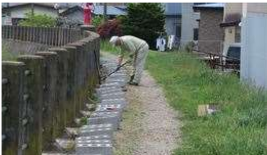
↑ 5/28 植え付け前のブロックを並べる菅原会長