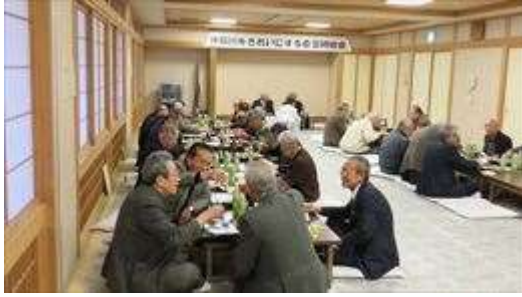
↑ 総会後の懇親会で談笑する皆さんの様子①

総会後の懇親会は、なかなか会う機会のない町会長さん達の情報交換の場としても活用していただいている様です。 今年も、18時頃から始まりましたが、盛り上がったこともあって19時30分過ぎまで続きました。 会場の後始末を終えたのが20時頃でした。