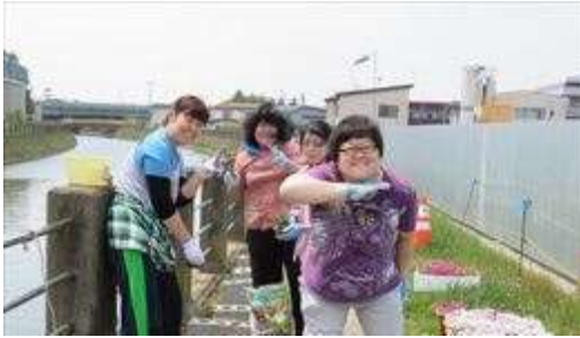
↑ 5/28 植え付け作業の合間にパチリ

5月28日、29日の両日は、近くの事業所からお手伝いに駆けつけてくださいました。写真を撮れなかった皆さんごめんなさい。