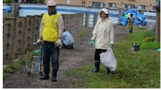
↑ 西上古川第二町会による土手の草刈風景（その1）です