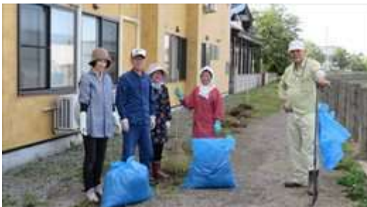
↑ 西上古川第二町会の清掃活動風景です