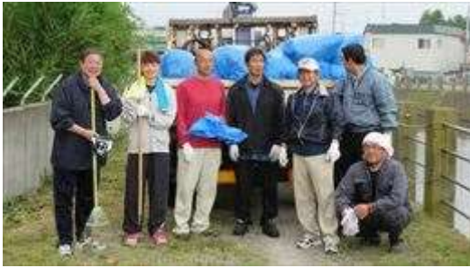
↑ 沖館川を考える会のみなさんです（活動後）