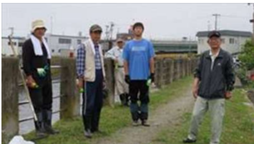
↑ 相野第一町会による土手の草刈風景です