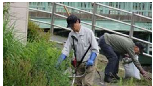
↑ 沖館第二町会による土手の草刈風景です