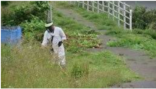
↑ バイタウン町会による土手の草刈風景です

第 1 回 目 の ク リ ー ン 作 戦 は 6 月 2 3 日 ~ 7 月 6 日 の 期 間 を 設 定 し て 実 施 し ま し た が 、 6 月 3 0 日 ま で で 全 箇 所 活 動 終 了 と な り ま し た 。