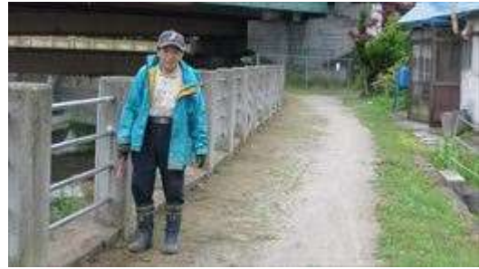
↑ 桐島町会による土手の草刈風景です 事前に終えていました（点検中でした）