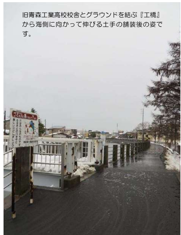
旧青森工業高校校舎とグラウンドを結ぶ『工橋』から海側に向かって伸びる土手の舗装後の姿です。