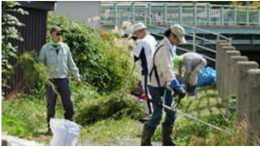
↑ 沖館第四・第二町会による土手の草刈風景です