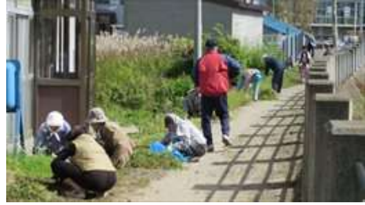
↑ 切島町会による土手の草刈風景です