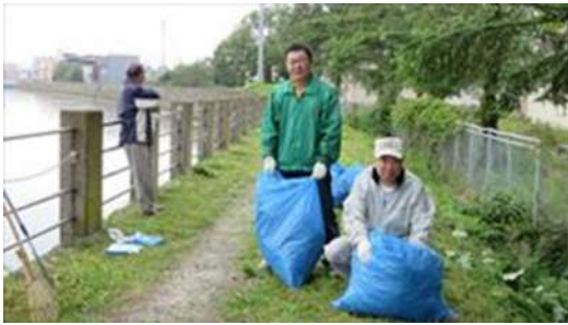
↑ 西上古川町会による土手の草刈風景です