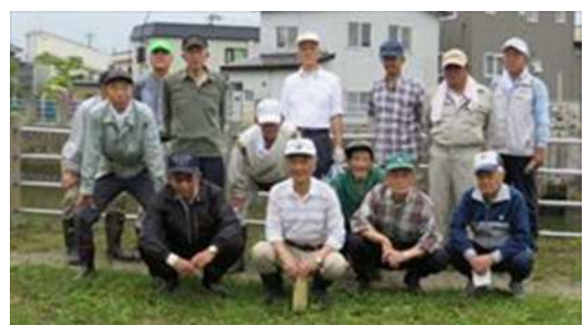
↑ 沖館第二、第四町会のみなさんです（活動後）