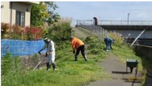
↑ ペイタウン町会による土手の草刈風景です