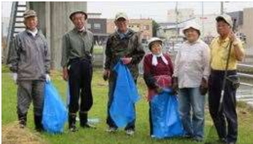
↑ 沖館第三町会の清掃活動風景です

さ ら に 、 最 終 的 に ゴ ミ の 処 分 を し て 下 さ る 青 森 市 役 所 の 関 係 個 所 に も 感 謝 申 し 上 げ ま す 。