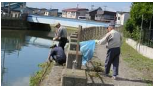
↑ 沖館第二町会による土手の草刈風景です