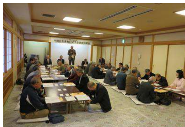
画像は、総会と総会終了後の懇親会の様子です。