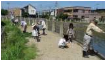
大福町会の草刈風景です