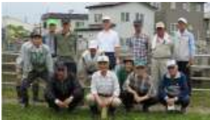
沖館第二、第四町会の皆さんです