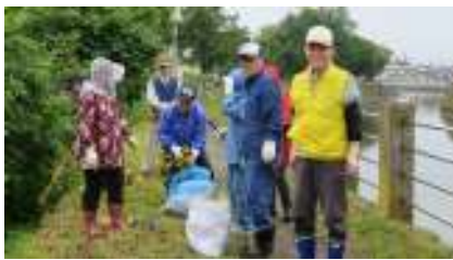
西上古川第二町会の皆さんです