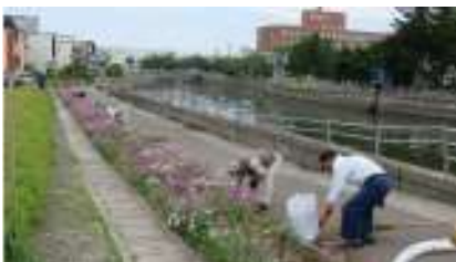
沖館地域緑の募金協会の清掃活動風景です