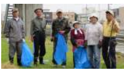
沖館第三町会の皆さんです