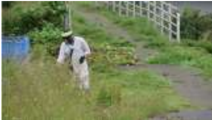
バイタウン町会の草刈風景です