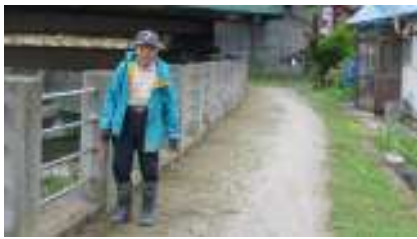
切島町会清掃活動後の点検中風景です