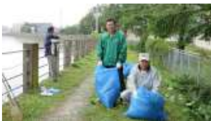
西上古川町会の皆さんです