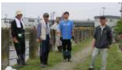
相野第一町会の皆さんです