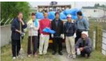
沖館川を考える会の皆さんです