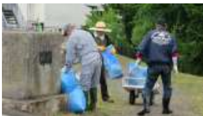
富田町会の清掃活動風景です